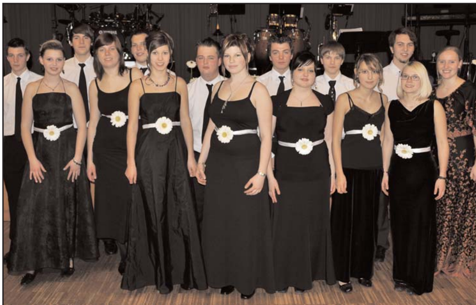
Als kleines Dankeschön an die Haager Jugend (Sprengel und KJ) für die Eröffnung der Blau weißen Nacht gab es einen tollen Nachmittag in der GOCART-Halle in Steyr.