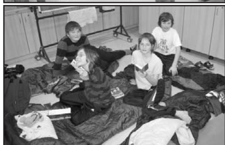
Die Spiel- und Lesenacht der 1a im Rahmen der Buchausstellung war für alle Kinder ein herrliches Vergnügen!