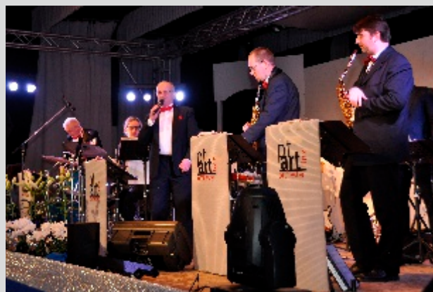
Wie im letzten Jahr sorgte auch 2016 pt-art wieder für musikalische Begleitung der besonderen Art.