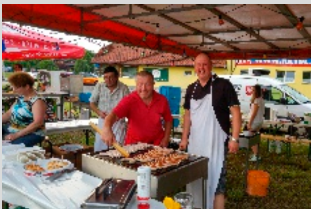
Auch beim diesjährigen Sonnwendfeuer des ÖAAB Haag musste niemand auf sein Essen warten