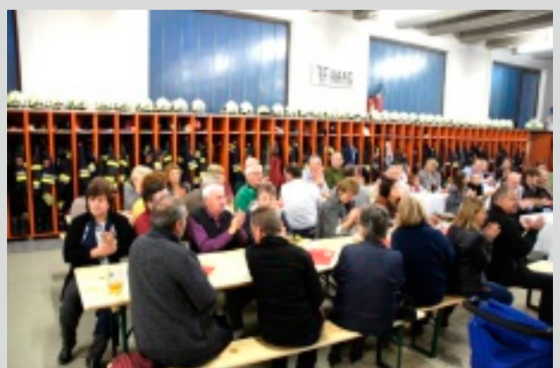
Die freiwillige Feuerwehr Stadt Haag freute sich über zahlreiche Besucher am Familienfest 2016