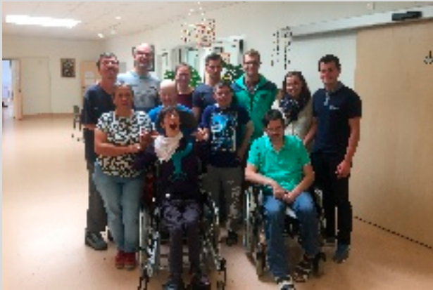
Die Lebenshilfe freute sich über eine 1.000 Euro Spende der JVP Haag im Zuge des Projekts "Original Play - Von Herzen spielen"