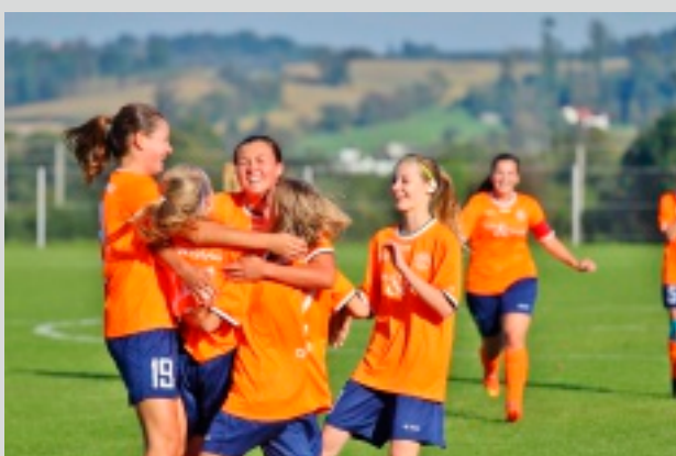
Auch in der Joker Möbel Frauenliga West bewies unsere Damenmannschaft fußballerische Stärke und erreichte den 4. Ligaplatz