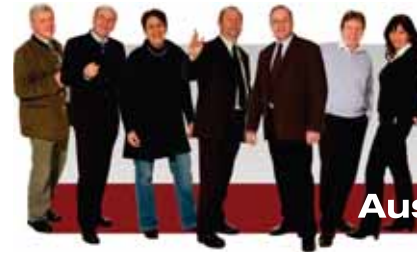
Beschlossen in den Sitzungen am 1. und 10. Juni 2010