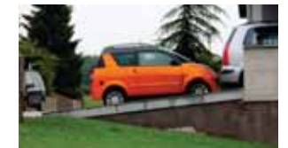
Das Team des ÖAAB Haag

Lieber Hansl, wir wünschen dir alles Gute für die Zukunft, viel Freude mit deinem allerneuesten tollen orangen Auto und viele heitere Stunden mit den Stammtischfreunden.