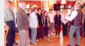
1. Halbtagesfahrt 2010

Die nächste Halbtagesfahrt am 6.7. ist für unsere Männer recht interessant, besichtigt wird CNH St. Valentin.