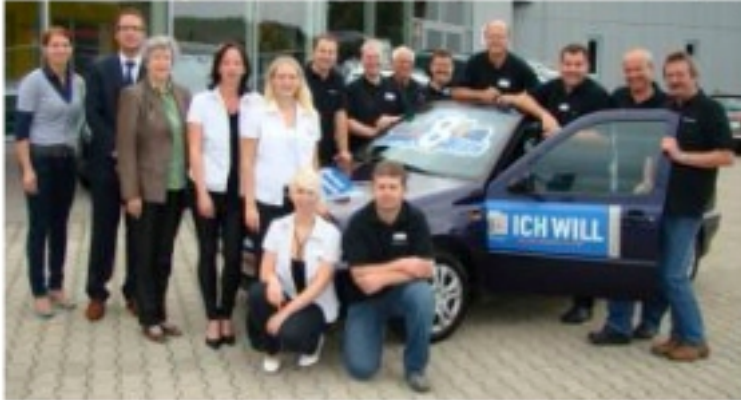
Das Senker-Team wünscht Ihnen ein schönes Osterfest!

Ab sofort sind die attraktiven und kostengünstigen 8plus Fixpreispakete auch für die fünfte Generation des Bestsellers erhältlich. Zudem gibt es die 8plus Angebotspalette für ausgewählte Volkswagen Nutzfahrzeugmodelle.