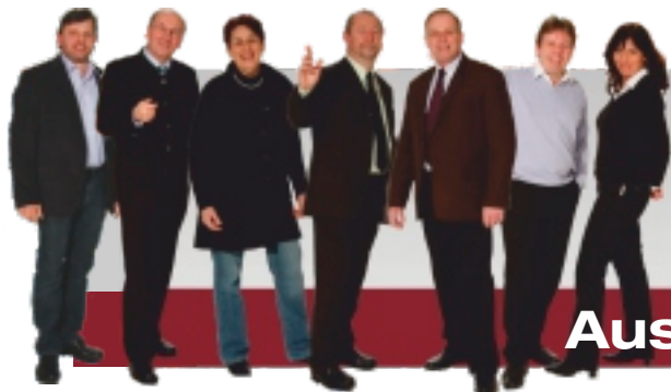
Beschlossen in den Sitzungen im Dezember 2011 und März 2012